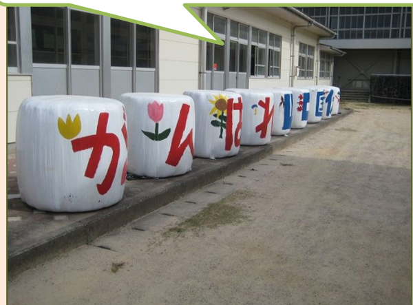
(社)山口県畜産振興協会

牧場、自治会、学校が連携し、白いキャンバスに山口国体応援メッセージを書き、2号線沿いに並べました。