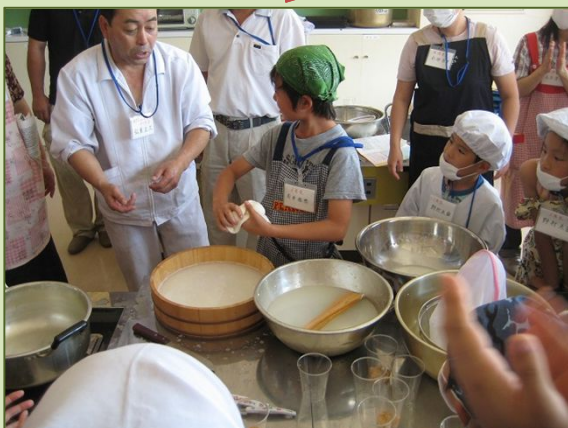
全国競馬・畜産振興会助成事業