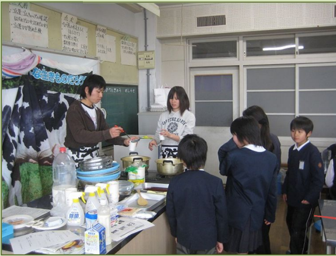
生クリームと牛乳でバター作り体験 (H22.11高千帆小学校)