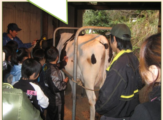
(社)山口県畜産振興協会