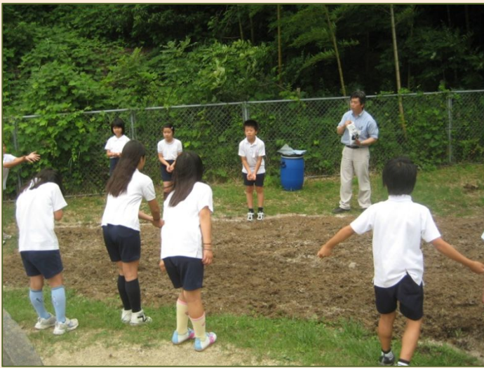
スーダングラスの刈取り・サイレージづくり (H22.9 灘小学校)

口蹄疫の発生で牧場への立ち入りを控えている時期、牛の食べる牧草を校庭で栽培し、収穫・サイレージにする体験後、ようやく牧場体験ができました。牛へのお土産もでき、草作りも学ぶことができました。