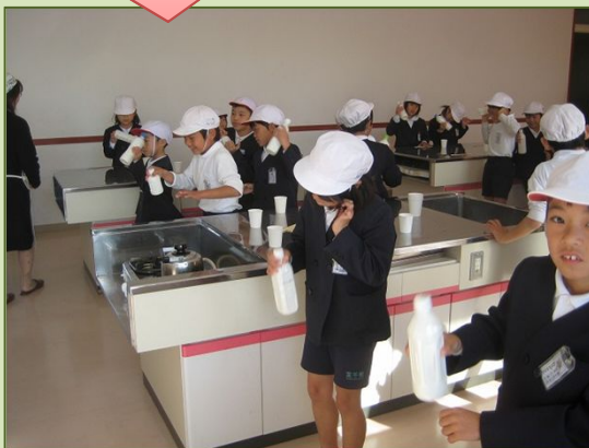
弘重さん(チーズ職人)がチーズ作り指導 (H21.6豊田前小学校)