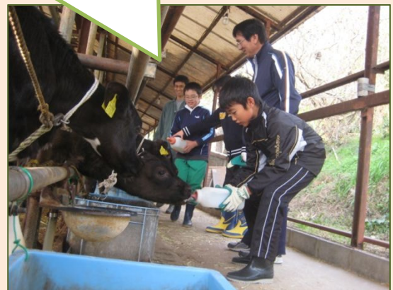
(社)山口県畜産振興協会