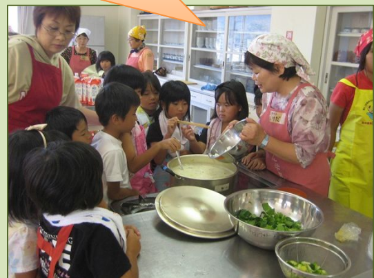
(社)山口県畜産振興協会