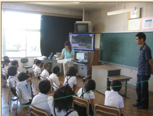
全国競馬・畜産振興会助成事業