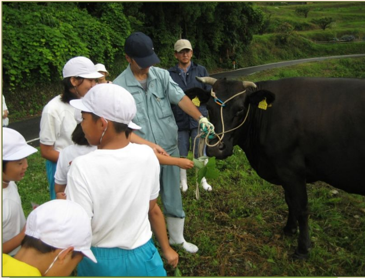
搾乳の様子を見学 (H21.10 河村牧場)

命をいただく学習は校区内にある放牧牛とのふれあいからスタート。その後、子牛の出前授業、搾乳の様子を見学し乳業工場を見学。翌年は、さらに、出前授業で酪農、養豚を学び、牧場での作業体験も実施しました。