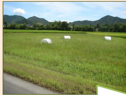
鑄銭司小学校周辺にはあちこちに白いロールベールが転がっています。

牧場、自治会、学校が連携し、白いキャンバスに山口国体応援メッセージを書き、2号線沿いに並べました。