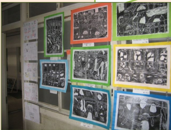
全国競馬・畜産振興会助成事業